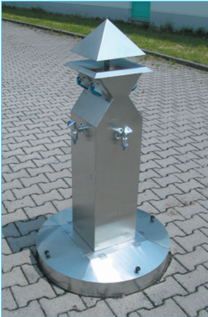
(Abb. mit optionaler Beleuchtungspyramide sowie 4 Auslaufventile und 4 Steckdosen)

Die durchdachte ...ganz schön praktisch Ver- und Entsorgungsstation für Campingplätze