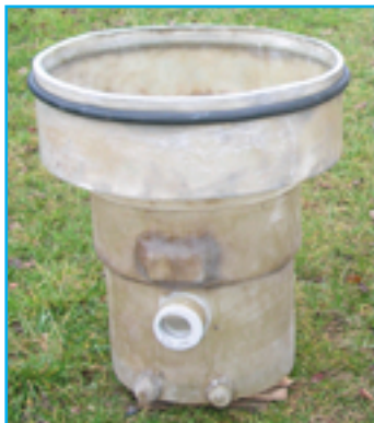
Schacht aus GFK